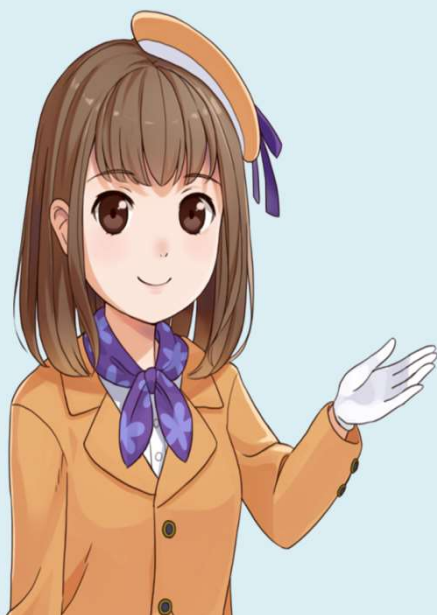
イメージキャラクター 花咲花子